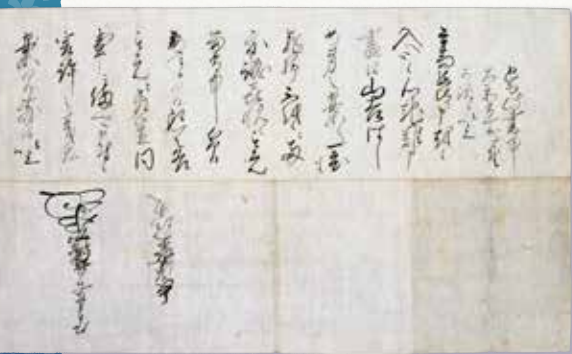
(年未詳) 9月27日付上杉景勝宛上杉謙信書状