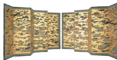
国宝「上杉本洛中洛外図屏風」(当館蔵)