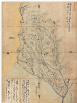
元禄10年(1697)6月「板谷李平山境検分絵図」(岩瀬家文書、市立米沢図書館蔵)【後期】