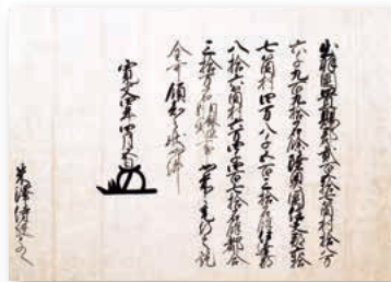
寛文4年(1664)4月5日 徳川家綱領知宛行状 (国宝「上杉家文書」、当館蔵)【通期】