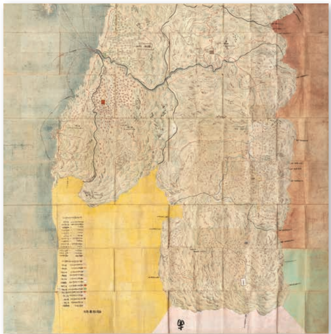
元禄14年(1701)2月「出羽一國御絵図」(上杉文書、当館蔵)【通期】