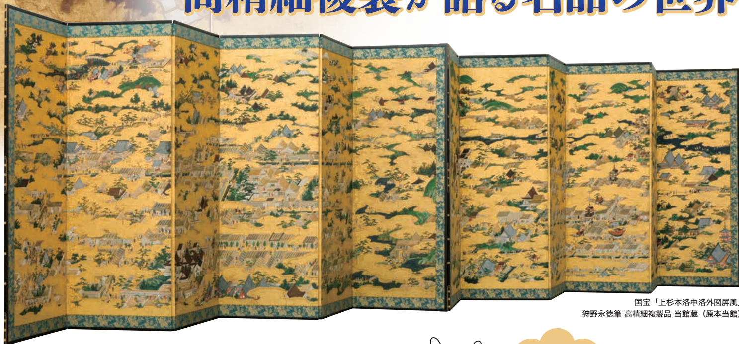
国宝「上杉本洛中洛外図屏風」 狩野永徳筆 高精細複製品 当館蔵（原本当館）

前期 — 2022.8.6 土 — 8.23 火 後期 — 8.25 木 — 9.11 日