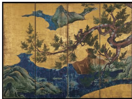
【通期】国宝「檜図屏風」 狩野永徳筆 高精細複製品 国立文化財機構文化財活用センター蔵 (原本 東京国立博物館)