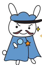
ぶちシャーロック

前期 — 2022.8.6 土 — 8.23 火 後期 — 8.25 木 — 9.11 日