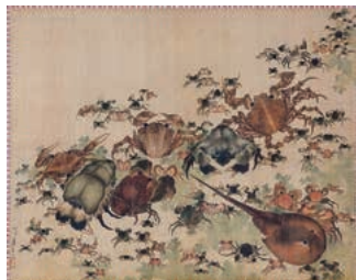
Freer Gallery of Art, Smithsonian Institution, Washington, D.C.: Gift of Charles Lang Freer, F1902.254

【後期】 「蟹尽し図」 葛飾北斎筆 高精細複製品 墨田区・すみだ北斎美術館蔵 (原本 フリーア美術館)