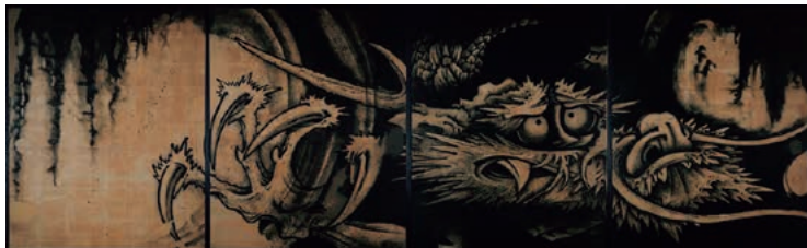
【後期】「雲龍図」 曾我蕭白筆 高精細複製品 臨済宗天龍寺派大本山天龍寺蔵 (原本 ポストン美術館)