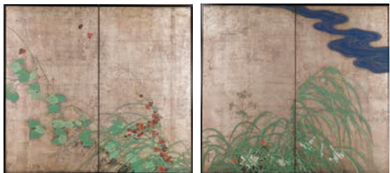
【通期】重要文化財「夏秋草図屏風」 酒井抱一筆 江戸時代・19世紀