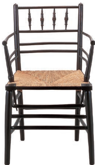
おそらくフィリップ・ウェブ 《サセックス・シリーズの肘掛け椅子》 1860年頃