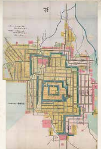
文化八年「御城下絵図」〔当館蔵〕【後期】