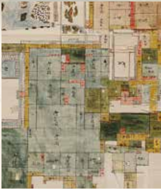
「米沢御城御式台表御座間ヨリ御奥向マデ御住居総絵図」(部分)〔当館蔵〕【通期】