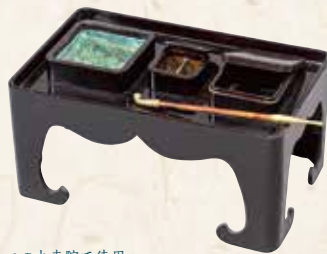
二の丸寺院で使用 蔵王堂什物 煙草盆〔当館蔵〕【後期】