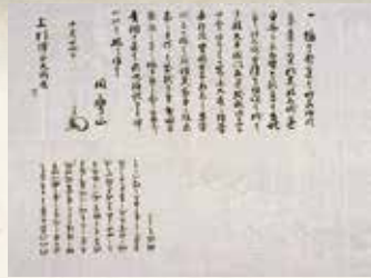
大手門の再建を祝う 国宝「上杉家文書」上杉斉定宛 上杉鷹山書状〔当館蔵〕【後期】