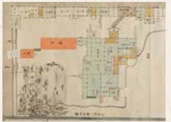
藩政の中核 「御役所絵図」(部分)〔当館蔵〕【通期】