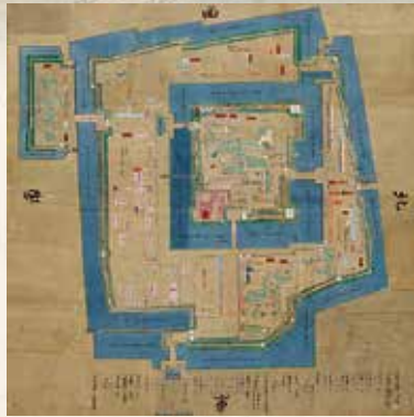
「御城内明細御絵図」〔個人蔵〕【通期】