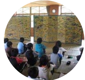
＜学校への出前授業＞