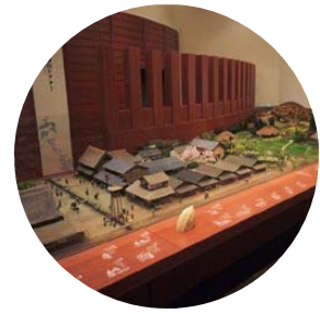
＜博物館・常設展示室＞ 置賜・米沢の歴史と文化 直江兼続、上杉鷹山の業績