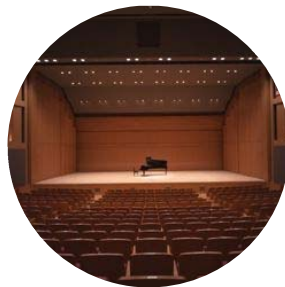
＜ホール＞ 500席のホールでは コンサートや様々な催事を開催