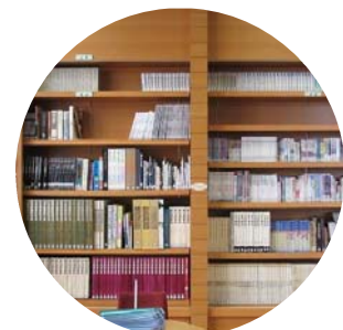
＜情報ライブラリー＞ 歴史、美術、伝統芸能などの 書籍の閲覧、パソコンで調べ学習