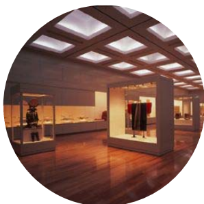
＜博物館・企画展示室＞ 年間6本の様々な展覧会を開催