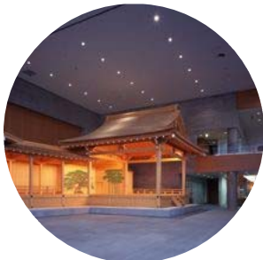
＜エントランス＞ 能舞台がお出迎え 米沢と能楽の関係を象徴

伝国の杜は、米沢市上杉博物館(米沢市立)、置賜文化ホール(山形県立)の合築施設です。授業の一環として学校単位、クラス単位の団体見学、少人数グループ単位の見学など、さまざまな形の活用ができます。事前にご相談いただくことで、よりよい体験学習が可能となります。お気軽にご連絡ください。