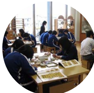
＜体験学習室＞ 日本伝統の手わざや、昔遊び、 造形活動を展開