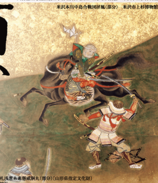
◀本小札浅葱糸壽懸威胴丸(部分) [山形県指定文化財] 上杉神社

休館日: 5月27日(水) 開館時間: 9時 ~ 17時 (入館は16時30分まで) 主催: 米沢市上杉博物館