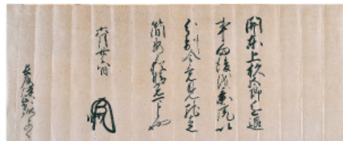
▲足利義輝御内書(国宝「上杉家文書」) 米沢市上杉博物館