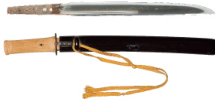
▲短刀 銘吉光(号五虎退) 個人蔵