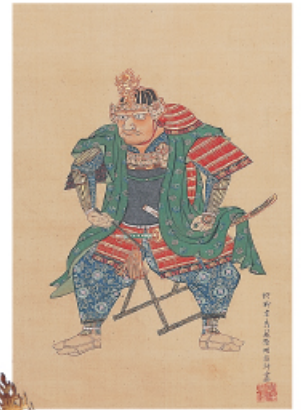
▲上杉弾正大弼輝虎公真像(部分) 法音寺