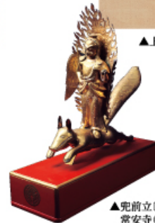
▲兜前立(長岡市指定文化財) 常安寺(長岡市)